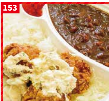
タルタルザンギカレー