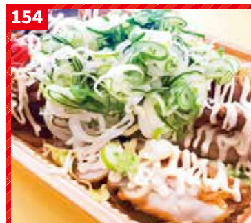
ねぎマヨザンギ丼