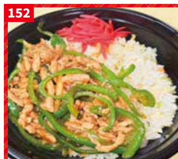
豚チンジャオ炒飯